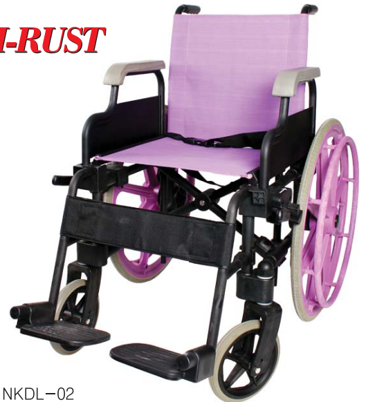
Model No : NKDL-02