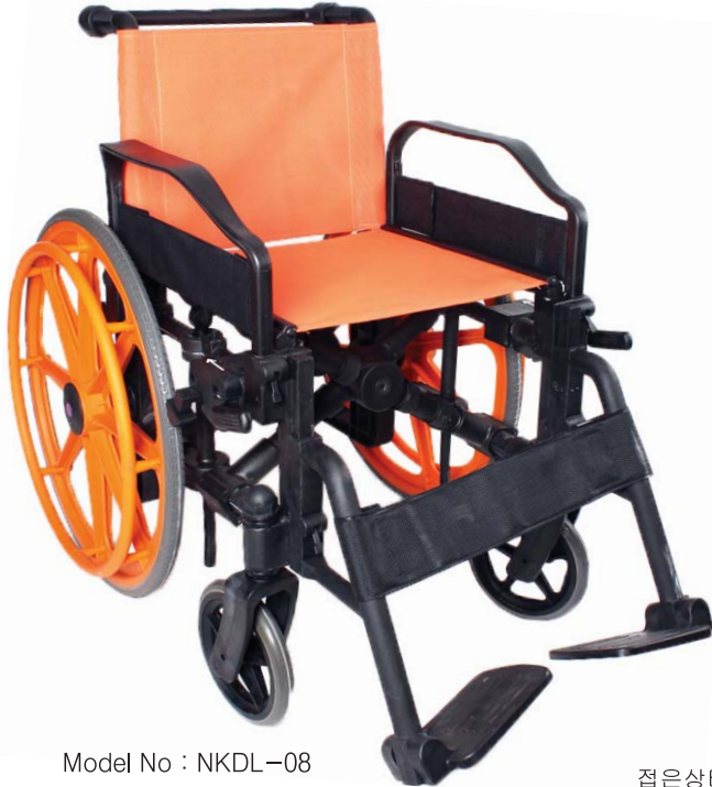
Model No : NKDL-08