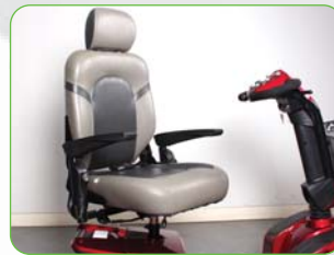
45도 간격 회전