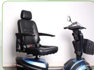
45도 간격 회전